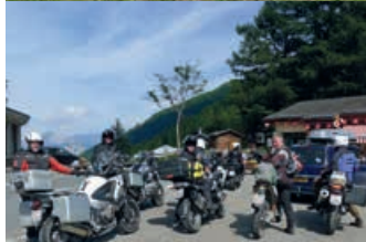
Start um 6 Uhr in der Waldegg